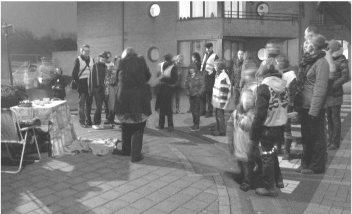
Kortom, een geslaagd weekeinde, met in totaal meer dan 300 mensen die meededen en –genoten!