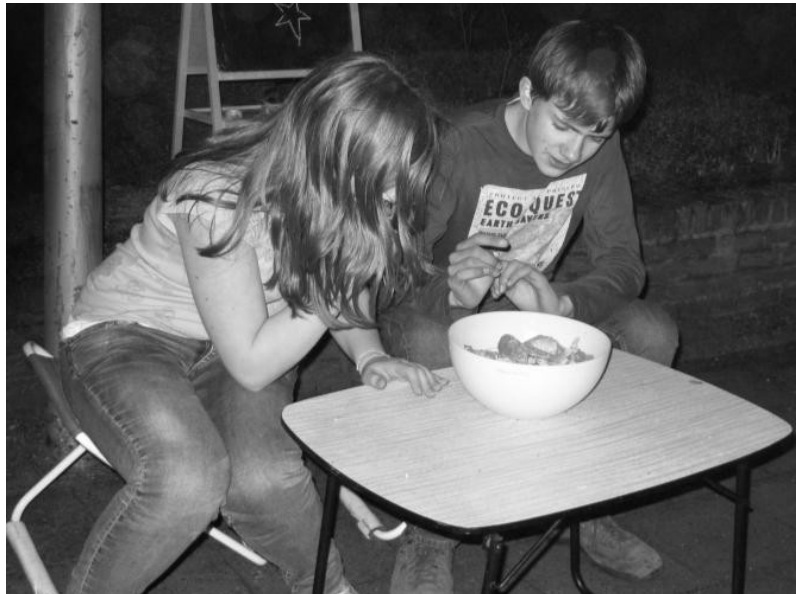
Op vrijdagavond: knappe sketches tijdens de Theatertocht