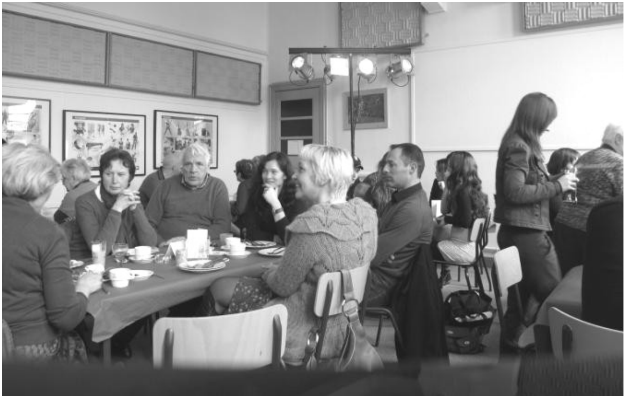
Op zondagochtend een gezellige drukte tijdens Toast Verbaal, maar ook achteraf.